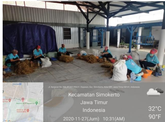
PT SINAR KENTJANA SURABAJA JL. KENJERAN 80-84