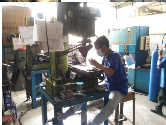
PT MARTHYS ORTHOPAEDICS INDONESIA JL. RUNGKUT INDUSTRI IX NO. 2