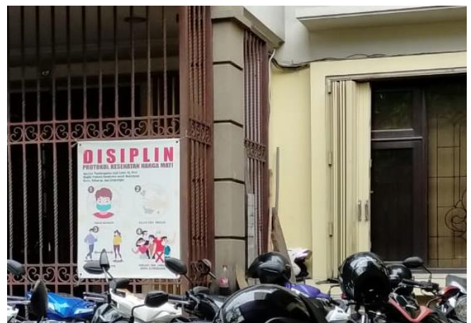
DINASTY MAS PRIMA JL. KENJERAN NO. 627