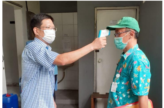
PO PILAR MAS JL. LEBAK ARUM 6 NO.9