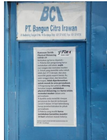
PT BANGUN CITRA IRAWAN JL. KEDINDING TENGAH II NO.16