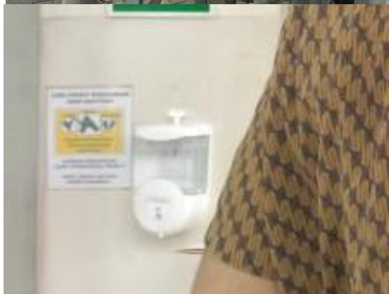
PT KIAN MULIA MANUNGGAL JL. RUNGKUT INDUSTRI III NO. 11